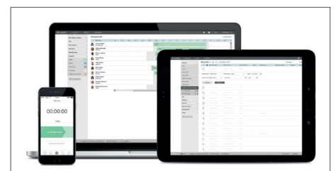
Alternativ Nutzung der TimeMoto Cloud (30-tägige Testversion im Lieferumfang enthalten)