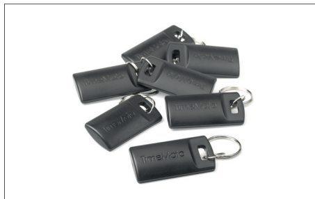
TimeMoto RF-110 Satz mit 25 RFID-Schlüsselanhängern Art.no: 125-0604