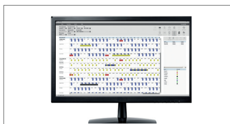
Einschließlich TimeMoto Desktop-Software zur Verwendung an einem einzelnen PC