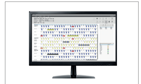
TimeMoto PC-Software Plus Art.no: 139-0600