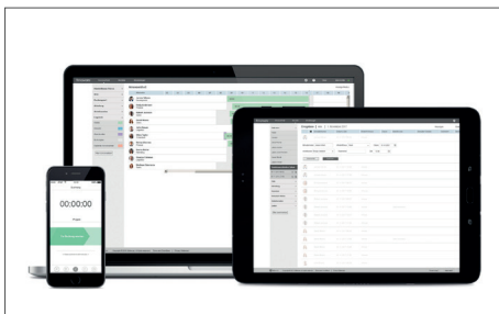
TimeMoto Cloud / TimeMoto Cloud Plus Art.no: 139-0590 / 139-0591