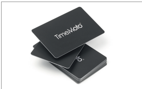
TimeMoto RF-100 Satz mit 25 RFID-Karten Art.no: 125-0603