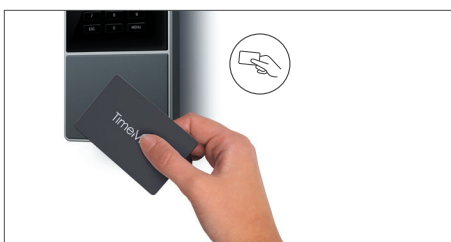
Anmelden durch Auflegen eines RFID-Ausweises oder Eingabe einer PIN

* Auswahl eines Abonnements nach Ablauf der 30-tägigen Testversion: TimeMoto Cloud oder TimeMoto Cloud Plus